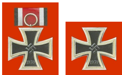
Железен кръст : 1-ва степен 2-ра степен

Петте степени на рицарския кръст, както са изброени по горе.